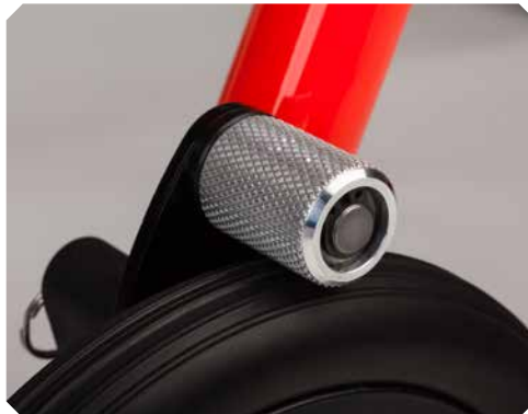
Leichtlauf-Rückroll Sperre für Größe 1-3.