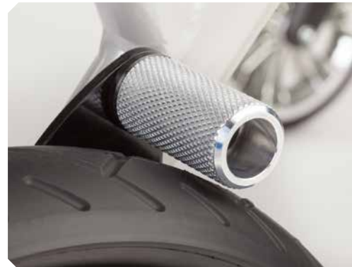
Rückroll Sperre für Größe 4.

Sicherheit durch (Leichtlauf-) Rücklaufsperrn.